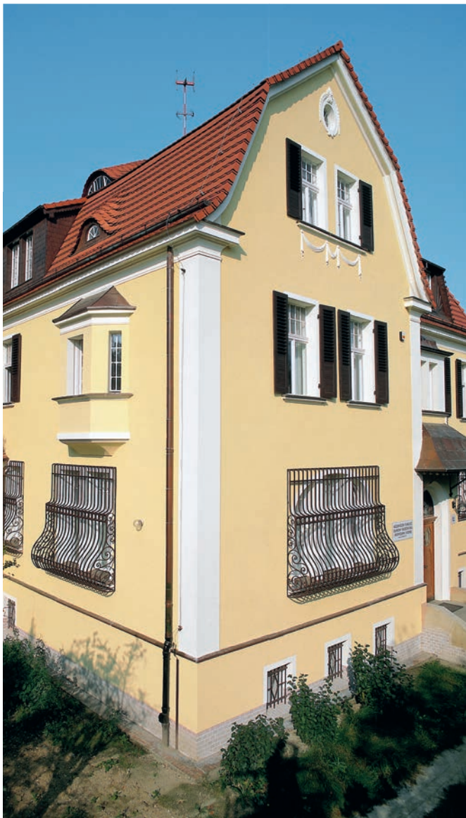
Referenz | 1