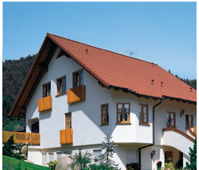
Referenz | 2