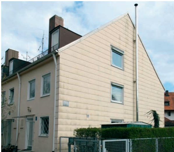
Haus von Familie Prestel | Vorher

„Wir fühlen uns wirklich wohl. Im Sommer, aber auch im Winter. Die Wärme hält sich super, es fühlt sich einfach toll an. Ich könnte nicht sagen, dass es mal einen Moment gab, in dem wir uns gefragt haben, ob die Entscheidung richtig war. Wir bereuen keinen einzigen Euro, den wir für die Sanierung ausgegeben haben.“