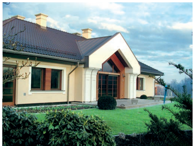
Referenz | 3